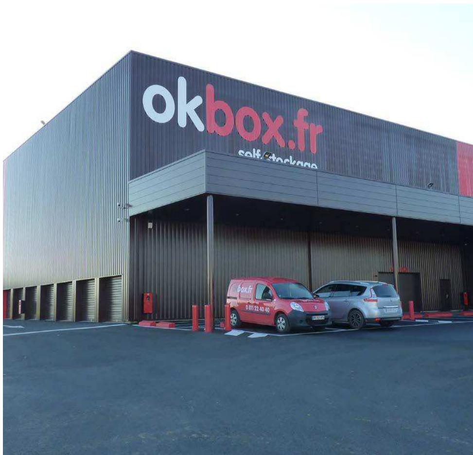
Murax Ridobox option laqué Ral 8017