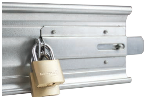
Verrou pour double cadenas extérieur (non fournis)