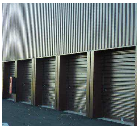
Murax Ridobox option laqué Ral 8017